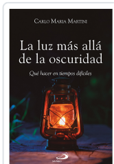
La luz más allá de la oscuridad Martini, Carlo Maria