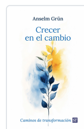
Crecer en el cambio Anselm Grün 17,26