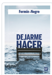
Dejarme hacer Negre, Fermin