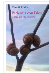
Paciencia con Dios Tomáš Halík