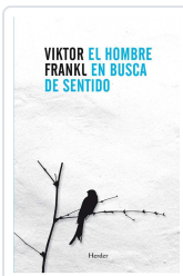
El hombre en busca de sentido Frankl, Viktor Emil