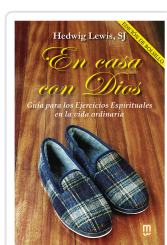
En casa con Dios - Edición de bolsillo Lewis SJ, Hedwig