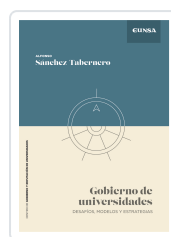
Gobierno de Universidades Sánchez-Tabernero, Alfonso