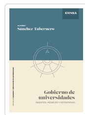
Gobierno de Universidades Sánchez-Tabernero, Alfonso