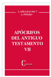
APOCRIFOS DEL ANTIGUO TESTAMENTO VII Diez Macho / Antonio Piñero