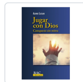
JUGAR CON DIOS