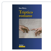
Triptico romano. Meditaciones Karol Wojtyla