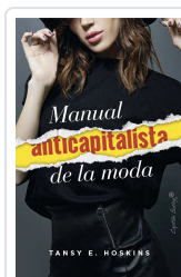
Manual anticapitalista de la moda Hoskins, Tansey E.