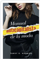
Manual anticapitalista de la moda Hoskins, Tansey E.