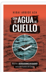
Con el agua al cuello Arbide Aza, Hiba