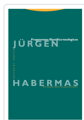
FRAGMENTOS FILOSÓFICO-TEOLÓGICOS (1ª R.) HABERMAS, JÜRGEN