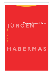
TIEMPO DE TRANSICIONES (1ª REIMPRESIÓN) HABERMAS, JÜRGEN