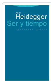
Ser y tiempo Heidegger, Martin