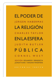
EL PODER DE LA RELIGIÓN EN LA ESFERA PÚBLICA HABERMAS, JÜRGEN Y OTROS