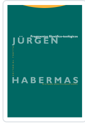
FRAGMENTOS FILOSÓFICO- TEOLÓGICOS (1ª R.) HABERMAS, JÜRGEN