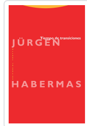
TIEMPO DE TRANSICIONES (1ª REIMPRESIÓN) HABERMAS, JÜRGEN