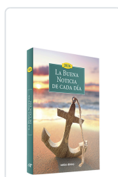
La Buena Noticia de cada día 2026