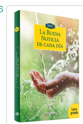
La Buena Noticia de cada día 2027 - Letra grande