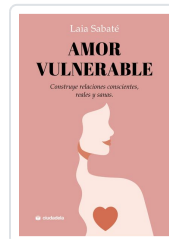
Amor vulnerable Sabaté, Laia