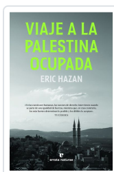
Viaje a la Palestina ocupada Hazan, Eric