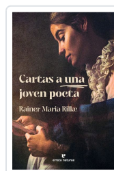
Cartas a una joven poeta Maria Rilke, Rainer