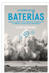
La guerra de las baterías Bednarski, Lukasz