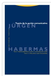
TEORÍA DE LA ACCIÓN COMUNICATIVA (2ª R.) HABERMAS, JÜRGEN