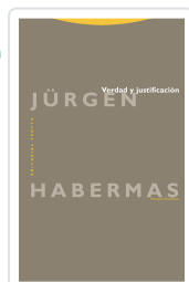
VERDAD Y JUSTIFICACIÓN (3ª REIMPR.) HABERMAS, JÜRGEN