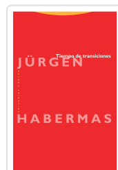
TIEMPO DE TRANSICIONES (1ª REIMPRESIÓN) HABERMAS, JÜRGEN