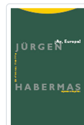
AY, EUROPA! (1ª REIMPRESIÓN) HABERMAS, JURGEN