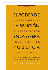
PODER DE LA RELIGIÓN EN ESFERA PÚBLICA HABERMAS, JÜRGEN Y OTROS