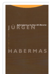
ACLARACIONES A LA ÉTICA DEL DISCURSO (1ª REIMPR.) HABERMAS, JÜRGEN