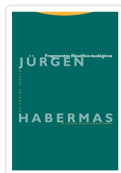
FRAGMENTOS FILOSÓFICO-TEOLÓGICOS (1ª R.) HABERMAS, JÜRGEN