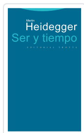
Ser y tiempo Heidegger, Martín