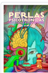
PERLAS PSICOTRÓNICAS DE LA CIENCIA FICCIÓN JAPONESA UNNO, JUZA