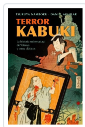
Terror Kabuki Tsuruya Namboku IV