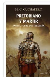
Pretoriano y mártir M.C. Cucharero