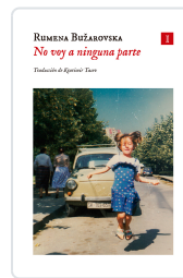
No voy a ninguna parte Bužarovska, Rumena