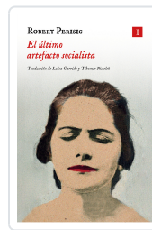
El último artefacto socialista Perišić, Robert