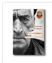
Arraianos. Ed. 10 Aniversario Méndez Ferrín, Xosé Luís