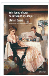
Veinticuatro horas de la vida de una mujer Zweig, Stefan