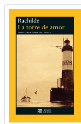
Torre de amor, La Rachilde