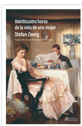
Veinticuatro horas de la vida de una mujer Zweig, Stefan