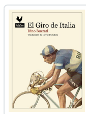
El Giro de Italia Buzzati, Dino