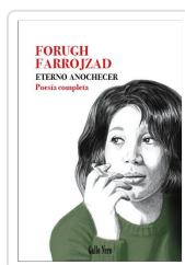
Eterno anochecer Farrojad, Forugh