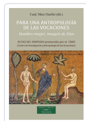
Para una antropología de las vocaciones Marc Ouellet