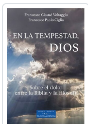
En la tempestad, Dios Francesco Giosuè