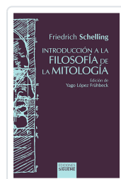
Introducción a la filosofía de la mitología Schelling, Friedrich Wilhelm Joseph