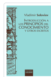
Introducción a los principios del conocimiento y otros escritos Vladimir Soloviov