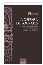
La defensa de Sócrates Platón