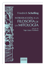
Introducción a la filosofía de la mitología Schelling, Friedrich Wilhelm Joseph