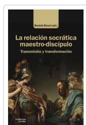
La relación socrática maestro-discipulo