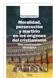
Moralidad, persecución y martirio en los orígenes del cristianismo González Salinero, Raúl