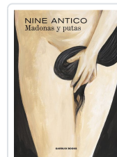
Madonas y putas Antico, Nine