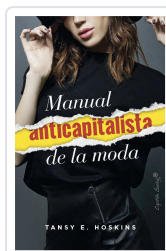
Manual anticapitalista de la moda Hoskins, Tansey E.