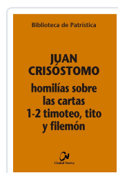
Homilias sobre las Cartas 1-2 Timoteo, Tito y Filemón Juan Crisóstomo