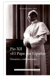
Pío XII. "El Papa por España" Vicente Carcel Ortí