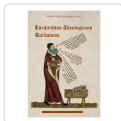
Enchiridion Theologicum Lullianum Ramon Llull