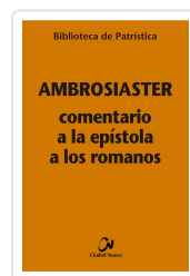
Biblioteca de Patrística Comentario a la Epístola a los Romanos Ambrosiaster