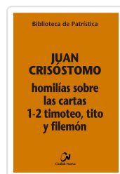
Biblioteca de Patrística Homilias sobre las Cartas 1-2 Timoteo, Tito y Filemón Juan Crisóstomo