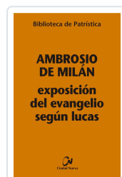
Biblioteca de Patrística EXPOSICION DEL EVANGELIO SEGÚN LUCAS Ambrosio de Milán