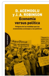
Economía versus política Acemoglu, Daron; Robinson, James A.