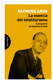
La esencia del totalitarismo Aron, Raymond