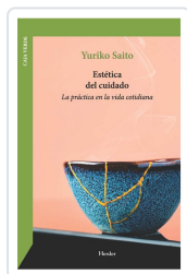
Estética del cuidado Yuriko Saito