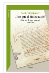
¿Por qué el holocausto? Saul Friedländer