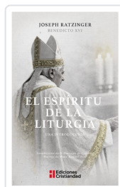
El espíritu de la liturgia Joseph Ratzinger (Benedicto XVI)