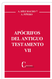
APOCRIFOS DEL ANTIGUO TESTAMENTO VII Diez Macho / Antonio Piñero