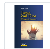
JUGAR CON DIOS