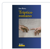
Triptico romano. Meditaciones Karol Wojtyla