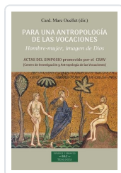
Para una antropología de las vocaciones Marc Ouellet