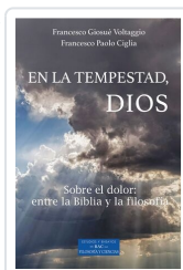
En la tempestad, Dios Francesco Giosuè