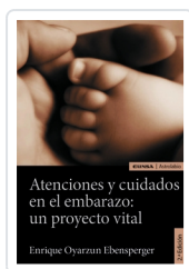
Atenciones y cuidados en el embarazo: un proyecto vital Oyarzun Ebensperger, Enrique