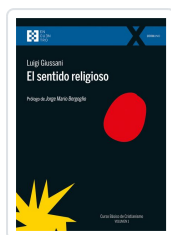
El sentido religioso Giussani, Luigi