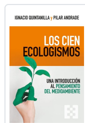
Los cien ecologismos Quintanilla Navarro, Ignacio; Andrade Boué, Pilar