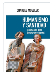
Humanismo y santidad Moeller, Charles