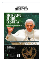
Vivir como si Dios existiera Ratzinger (Benedicto XVI), Joseph