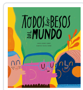
Todos los besos del mundo Morros, Marta