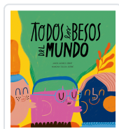
Todos los besos del mundo Morros, Marta