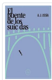
El puente de los suicidas Ussia Homedo, Alfonso J