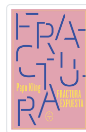
Fractura expuesta Kling, Papo