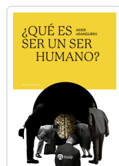
¿Qué es ser un ser humano? Aranguren Echevarría, Javier