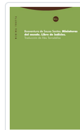
Miniaturas del mundo Santos, Boaventura de Sousa