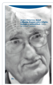
ISRAEL O ATENAS (2ª ED.) HABERMAS, JÜRGEN