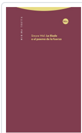
La 'Iliada' o el poema de la fuerza Weil, Simone