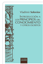
Introducción a los principios del conocimiento y otros escritos Vladimir Soloviov