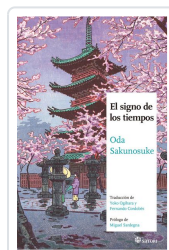
EL SIGNO DE LOS TIEMPOS Oda, Sakonosuke