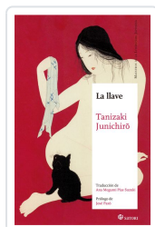
LA LLAVE Tanizaki, Junichiro