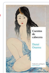
CUENTOS DE CABECERA DAZAI, OSAMU