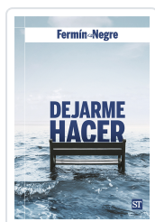
Dejarme hacer Negre, Fermin