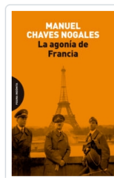
La agonía de Francia Chaves Nogales, Manuel