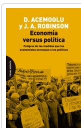
Economía versus política Acemoglu, Daron; Robinson, James A.