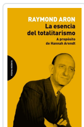
La esencia del totalitarismo Aron, Raymond